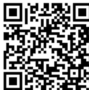
Mobilní aplikace (QR kód)